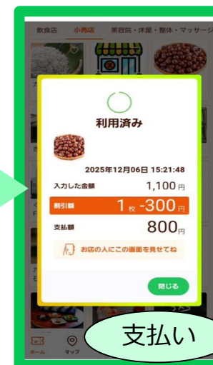
※画像は全てイメージ