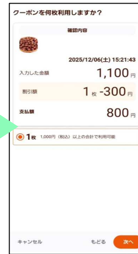
▲クーポン利用確認