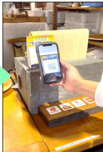
▲店頭のQRコード読取