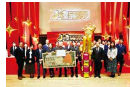
優勝者 メトロ電気工業株式会社