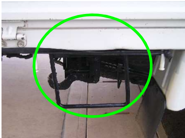
写真3：荷台後部側面足掛けアングル（両サイド）