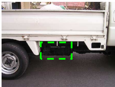
写真4：荷台下側面部ツールボックス

トイレ・遊具修理用の小道具（ドライバ、プライヤ等）を収めておく小箱。車体外側に向かって開く側面フタ。材質はステンレス又は鉄鋼板（要錆止め）。300～400×200×200程度。