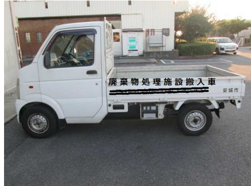
写真2：鳥居 ロープ等引っ掛けフック