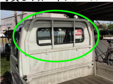
写真5：ガードフレーム

トイレ・遊具修理用の小道具（ドライバ、プライヤ等）を収めておく小箱。車体外側に向かって開く側面フタ。材質はステンレス又は鉄鋼板（要錆止め）。300～400×200×200程度。