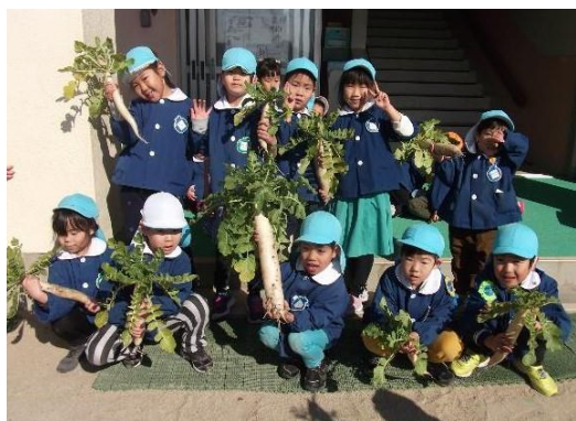
「だいこん収穫体験」

調査回答数 51 園（私立幼稚園 8、私立保育園 10、私立認定こども園 4、市立幼稚園 2、市立保育園 23、市立認定こども園 4）