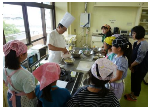
「ふわっふわのパンケーキを作ろう」 (作野公民館)