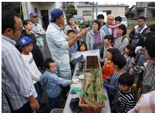
「親子いちごプランター植付体験」 （アグリライフ支援センター）