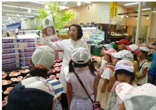
「ファイブ・ア・デイ食育体験ツアー」 (桜井公民館)