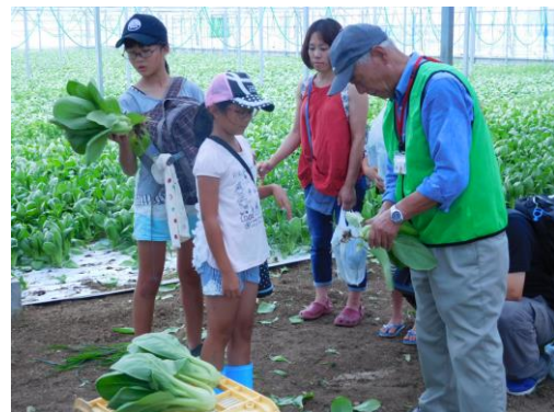
「日本デンマークわくわく体験」 （農業後継者確保対策事業）