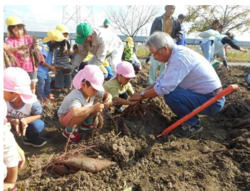
「地域の方とのさつまいも収穫・焼き芋体験」