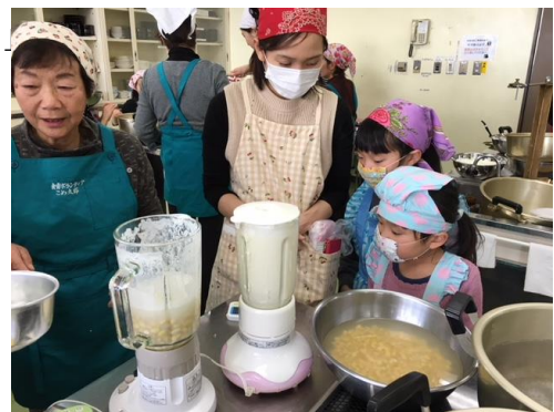
「親子で食育 豆腐づくり」