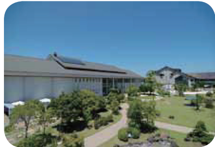
安城市歴史博物館