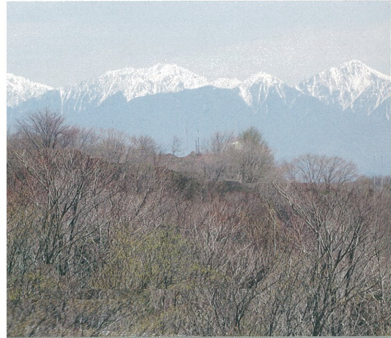
茶臼山から見た南アルプス

青い空、透きとおった風、静けさが広がる原生林の深い息づき…安城の“自然のふるさと”茶臼山高原野外センター。1,000m級の山々が連なる高原一帯は珍しい動物も多く、1,415mの山頂からはアルプス連山も望まれて雄大なパノラマの世界が広がります。