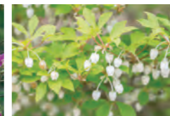
ドウダンツツジ (4-5月)