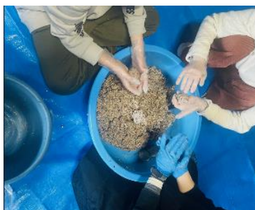
休耕地の再生を図り、大豆栽培から味噌の仕込みを通して食や農について学ぶ「豆のがっこう」

若者が文化芸術に継続して取り組む事のできる機会の確保、楽団の整備・充実及び指導者の確保を目的とした演奏会