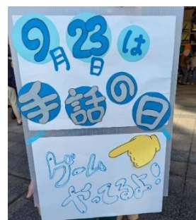
手話言語について市民へ認知を広めるため、ブルーライトアップ期間に合わせた啓発展示