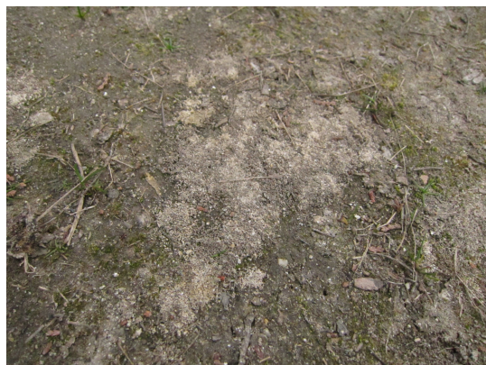
地面に出ているホタルミミズのふん土

ホタルミミズは、光る液を出すふしぎなミミズです。なぜか、冬に見つかりやすい生き物です。この冬、光るミミズをさがして、身近な自然を観察してみませんか。