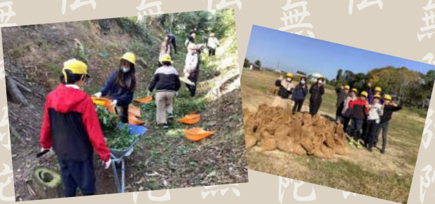
桜井小学校の子どもたちが、史跡整備を手伝ってくれました。

安城市教育委員会は、これまでに本證寺境内の発掘調査や歴史的建造物調査などの文化財調査を進めてきました。そして、「国史跡 本證寺境内」の文化財的価値を高め、広く皆様にその本質を理解していただくと共に、史跡を未来へ保存・継承するために、「本證寺史跡公園（仮称）」として、史跡整備を計画しました。