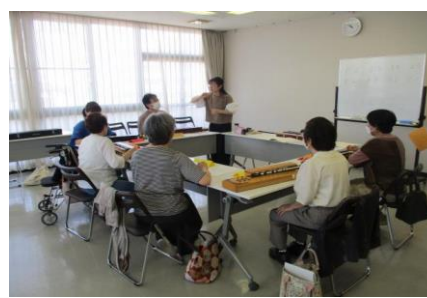
5/13「はじめての大正琴講座」の様子