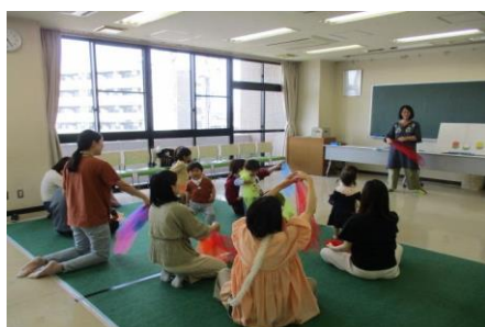
5/13「親子でたのしくリトミック♪」の様子