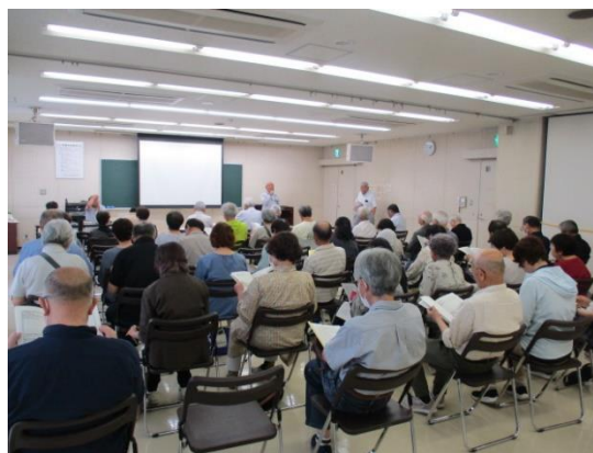
第1回「三河地震と南海トラフ」の様子