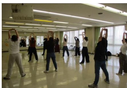
第1回「ママの心とカラダのエクササイズ」の様子