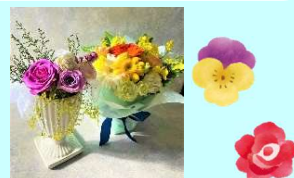
初夏のフラワーアレンジ レッスン