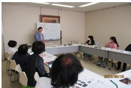
「トラベル韓国語講座」の様子