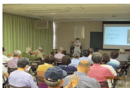
第2回「ツボで健康づくり ～東洋医学の健康観～」の様子