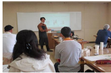
「スペシャルティコーヒー講座」の様子