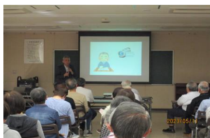
第1回「ズバリ教えましょう！ ～楽しい終活のいろは～」の様子