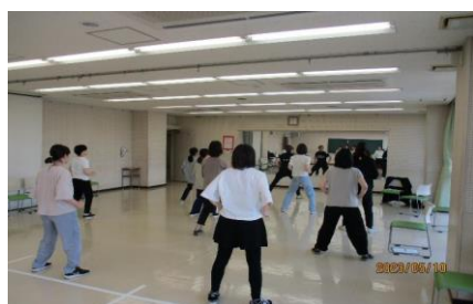
第1回「母のココロとカラダのリフレッシュ体操！」の様子