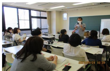
第2回「子どもの写真の撮り方」の様子