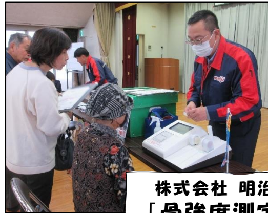
株式会社 明治 「骨強度測定」