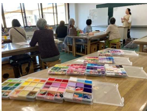
冬季 ちいめん細工のかんざしセット