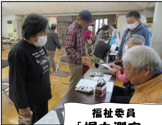
福祉委員 「握力測定」

令和6年11月30日（土）に和泉町で65歳以上の町民を対象とした健康フェスタが行われました。このフェスタは、シニア世代の健康づくりを地域で支援する目的で令和4年度より行われており、当日は福祉委員による「握力測定」やフィットネスクラブのカーブスによる「血圧測定」、リハビリテーション職員による「腰痛・膝関節痛予防講座」などが行われました。参加者からは「測定して自分の身体の状態が分かった」、「高齢者でも働ける仕事を知ることができた」などの感想が寄せられました。