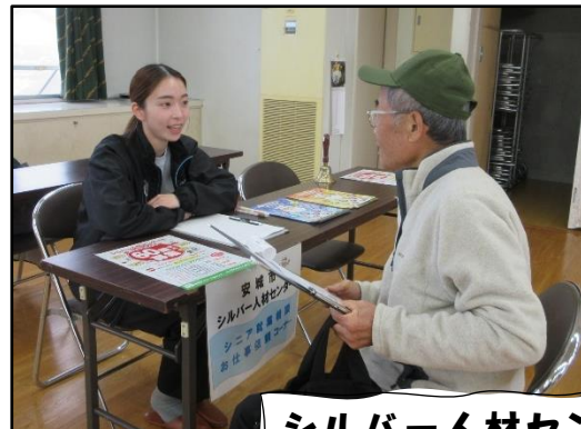
シルバー人材センター 「お仕事相談」