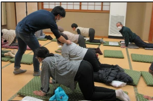
訪問看護ステーションおおた 「腰痛・膝関節痛予防講座」