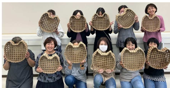
後期 猫の形のかご作り