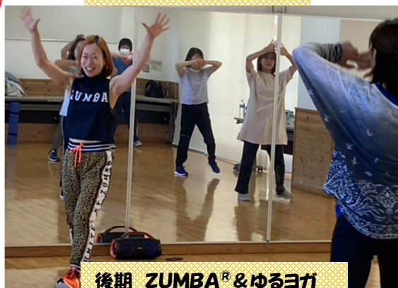
後期 ZUMBA® & ゆるヨガ