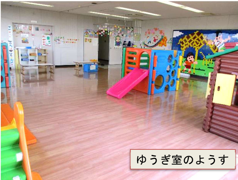
ゆうぎ室のようす