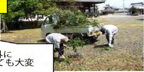
トラックに積み込んだり