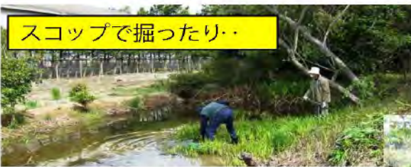
スコップで掘ったり..