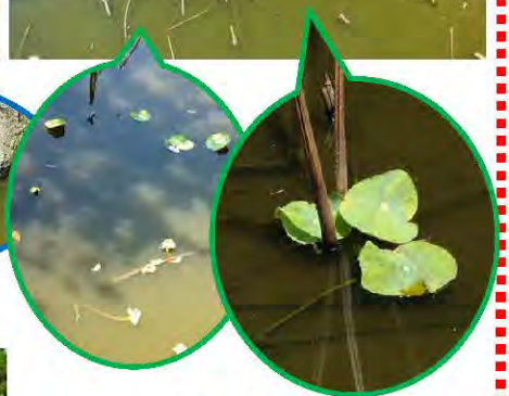
▼南西内堀（本堂の裏）