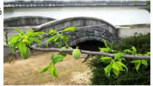
▲梅の実がつけました

4月18日（土）の 環境整備はたくさんの方々のご協力により無事終了しました。ありがとうございました。