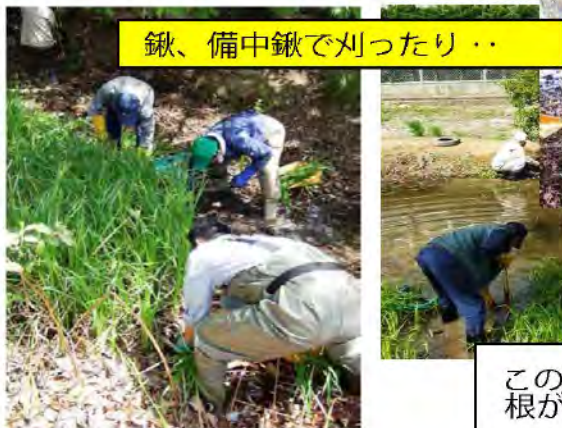
鍬、備中鍬で刈ったり..