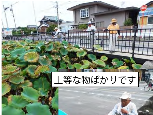
上等な物ばかりです