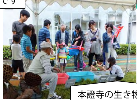
本證寺の生き物展示