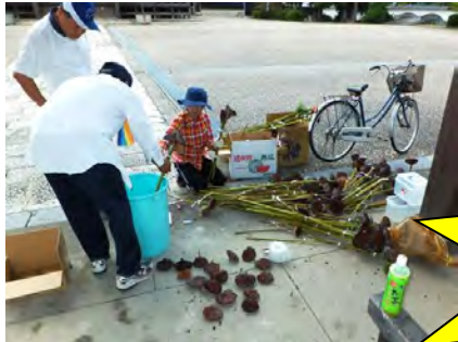
3本ずつ 束ねて販売です