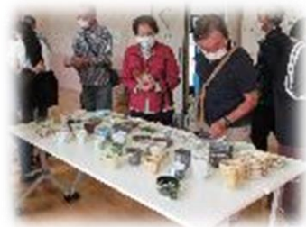
陶芸作品チャリティーバザー

☆詳しくは「市民陶芸まつり」のチラシをご覧ください。安祥公民館までお問合せください。