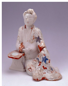
色絵婦人座像 江戸時代

春・秋の年二回、収蔵品の中から逸品を選んで特別に公開しています。今回は、膨大な名古屋城三の丸遺跡出土品のなかから選りすぐりの遺物を選んで展示します。