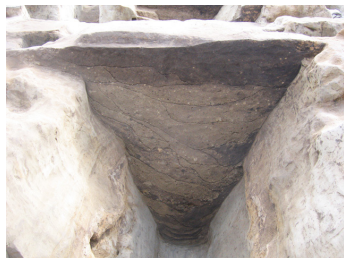
戦国時代(16世紀代)の堀断面 (6055D:2006年度調査)

同時開催 公益財団法人愛知県教育スポーツ振興財団 愛知県埋蔵文化財調査センター 令和5年度秋の埋蔵文化財展 名古屋城三の丸遺跡展 展示会場：愛知県埋蔵文化財調査センター2階 資料管理閲覧室