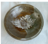
二彩唐津大皿 江戸時代