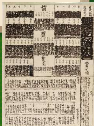
文化13年(1816) 俳諧節句附角力合（個人蔵）