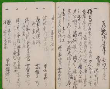
文久2年(1862)4月 盗難届（本館蔵「安政六年 諸願書控」所収）