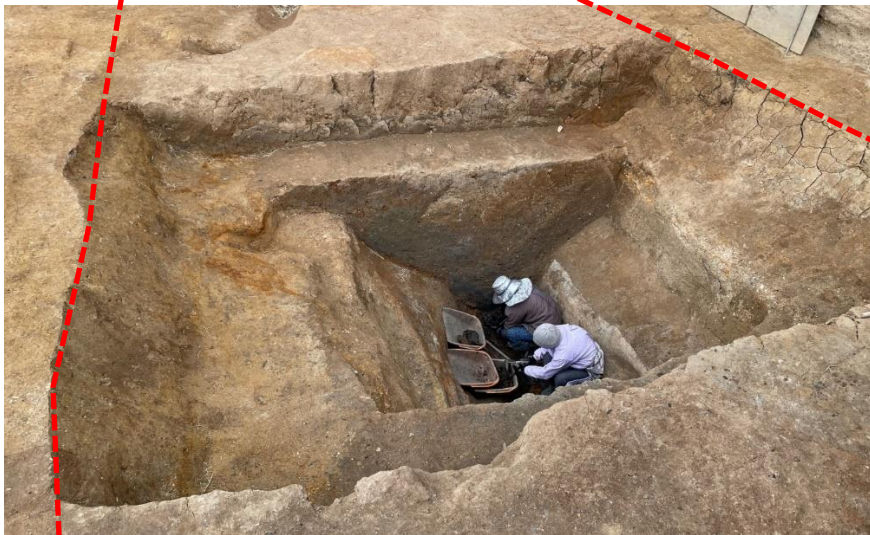
深さ約 3 m の内堀