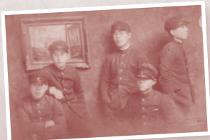
半田中学卒業記念写真