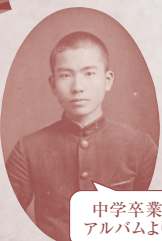
中学卒業アルバムより