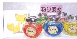
あやちゃんのわたあめ