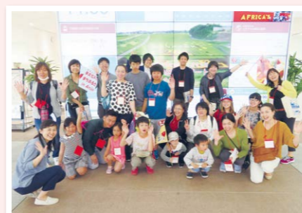
多文化共生城市漫步