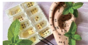
耳つぼマッサージと耳つぼジュエリー

日 7/25 (土) 10:00~11:30 対 高校生以上 定 12名 回 1回 参 300円