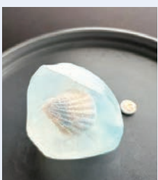
宝石せっけん ~夏~ (作野公民館)