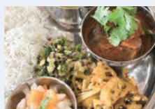
身近な素材で楽しむスパイス活用ごはん (明祥公民館)