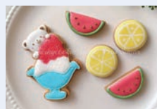
夏にぴったりなアイシングクッキーづくり (青少年の家)