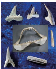
サメの歯化石をさがそう

日 7/25 (土) 10:00~11:30 対 小学生 定 20名 回 1回 参 200円