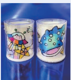
ディンプルアートで光るペン立て作り (東部公民館)