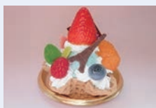
フェイクスイーツでワッフルパフェを作ろう (中部公民館)