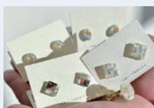
海洋プラスチックで作るマイヤリング® (桜井公民館)

日 8/22 (土) 10:00~11:30 対 小学生(小学3年生以下は保護者同伴) 定 10名 回 1回 参 2,100円