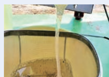
親子ではちみつしぼり体験 (北部公民館)