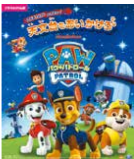
©2026 &TM Spin Master