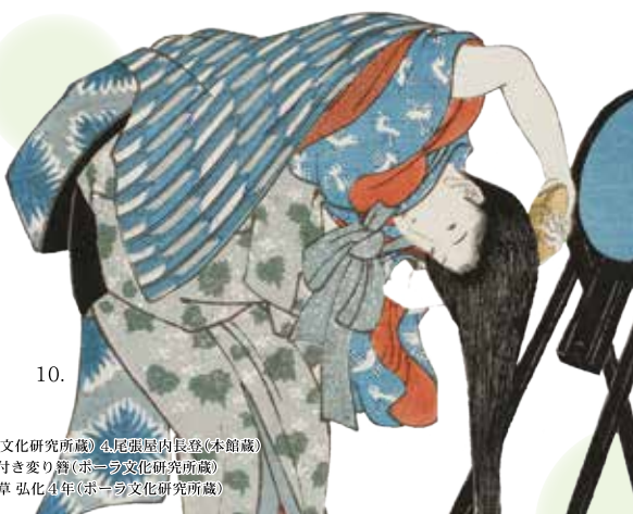
1.男髷(複製)(ホーラ文化研究所蔵) 2.大日本婦人東髪図解 明治18年(本館蔵) 3.松竹梅珊瑚飾りびらびら簪(ホーラ文化研究所蔵) 4.尾張屋内長登(本館蔵) 5.亀塚遺跡出土髷飾(愛知県埋蔵文化財調査センター蔵) 6.江戸名所模様時絵籠甲櫛(ホーラ文化研究所蔵) 7.万年青付き変り簪(ホーラ文化研究所蔵) 8.ラーベパッケージ(ホーユーヘアカラーミュージアム蔵) 9.ミツホ洗粉(ホーラ文化研究所蔵) 10.婦人たしなみ草 弘化4年(ホーラ文化研究所蔵)