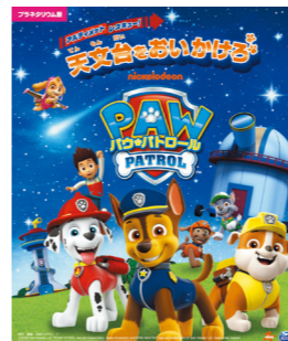
©2026 &TM Spin Master