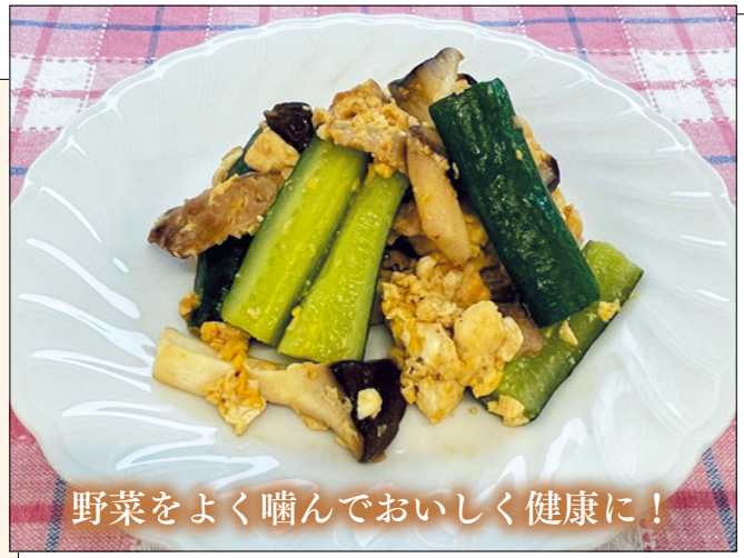
野菜をよく噛んでおいしく健康に！