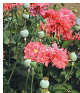
セティゲルム種 ソムニフェルム種