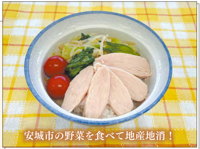
安城市の野菜を食べて地産地消!