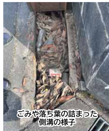
ごみや落ち葉の詰まった側溝の様子

答 まずは現地調査を行う。その結果、土砂等の堆積により側溝の断面が大きく阻害され、著しい排水不良を確認した場合には、地元町内会と調整した上で、市が側溝の清掃を行う。