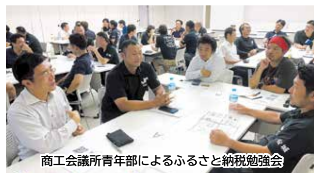
商工会議所青年部によるふるさと納税勉強会

答 JAあいち中央や安城商工会議所と協力し返礼品拡大を推進。商工会議所青年部の勉強会には約40人が参加し、15事業者から相談があり、4事業者が新たに5品を登録した。