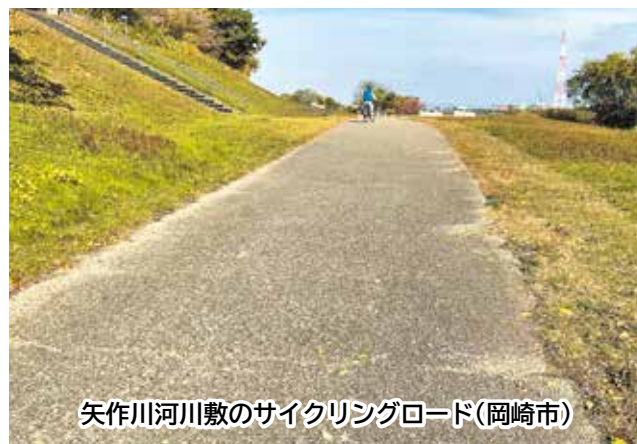
矢作川河川敷のサイクリングロード(岡崎市)

さらに、レクリエーションだけでなく、日常的に様々な場面で矢作川河川敷が利用されることを期待し、地域の風景を形づくり、市民に親しまれてきた本市の財産とも言える明治用水緑道と、矢作川河川敷を利用したサイクリングロードとのネットワーク化が実現できれば、自転車と水辺空間の活用による相乗効果が生まれるのではないかと夢を抱き、マニフェストに掲げた。矢作川の河川敷については、憩いの場として、高い魅力を感じている。その活用を図るために、引き続き近隣市との情報交換や、矢作川を管理する国土交通省との協議を行うなど、実現に向けて努めていく。