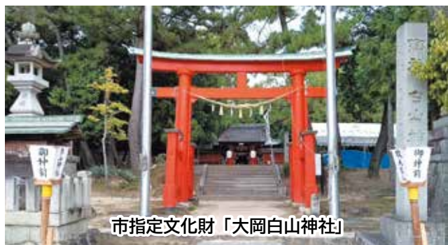
市指定文化財「大岡白山神社」

答 従前の「1000万円の上限金額」を撤廃し、利用しやすい制度に改正した。今後も歴史的建造物の保存についての理解を深めるための支援にも力を入れていく。