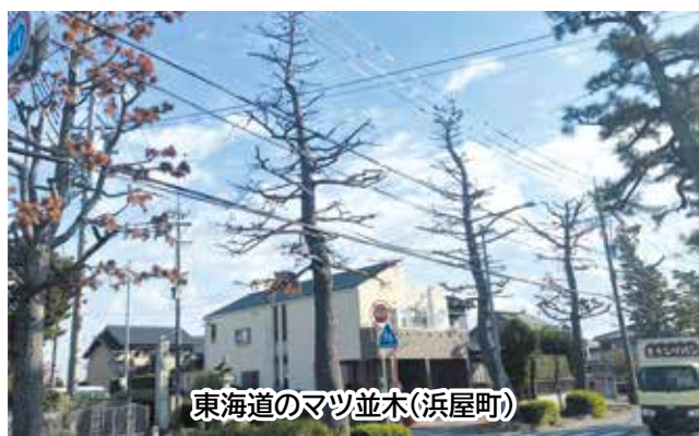
東海道のマツ並木(浜屋町)

答 浜屋町で6本、尾崎町で4本枯れた。令和5年度の強剪定により樹勢が弱まったことが原因。今年度中に伐採、来年度以降に捕植する。