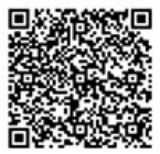
性暴力に関するSNS相談[Cure Time]

問 性犯罪被害相談電話(#8103)、性犯罪・性暴力被害者のためのワンストップ支援センター(#8891)、市民協働課(☎71)2218)