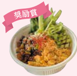
奨励賞 ちゃんめし 茶菜飯まぜまぜ丼