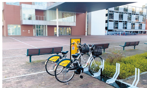
アンフォーレのシェアサイクルポート