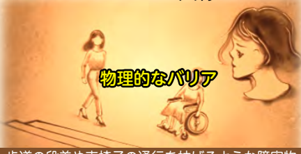
歩道の段差や車椅子の通行を妨げるような障害物

安城市では、あらゆる立場や状態にある人が相互に理解を深め支え合う心のバリアフリーを推進するため、「とうじしゃグループ」の協力のもと、啓発動画を制作しました。ぜひ、ご覧ください。