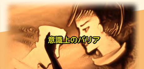
心ない言葉や無関心、差別