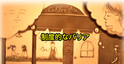
資格、免許などを与えないなどの制限