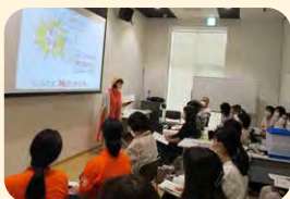
▲認知症サポーター養成講座の様子

9月の世界アルツハイマー月間にちなみ、9月2日(土)と9月21日(木)、アンフォーレにおいて認知症啓発イベントを開催し、約2,000名に参加いただきました。