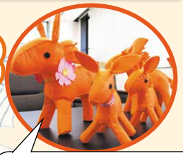
ぼくは、認知症サポーター キャラバンの「ロバ隊長」だよ。