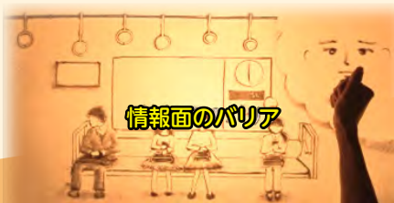
文字だけの案内など限定した情報発信