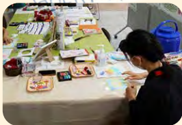
▲出張認知症カフェ 小物づくりの様子