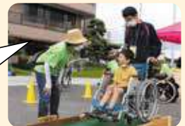
ボランティアとして 参加した学生さんの声