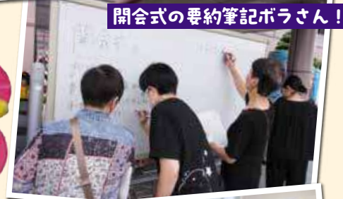
開会式の要約筆記ボラさん!