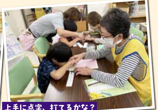
上手に点字、打てるかな?