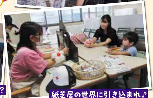
紙芝居の世界に引き込まれ!