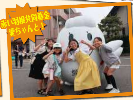
赤い羽根共同募金 愛ちゃんと!