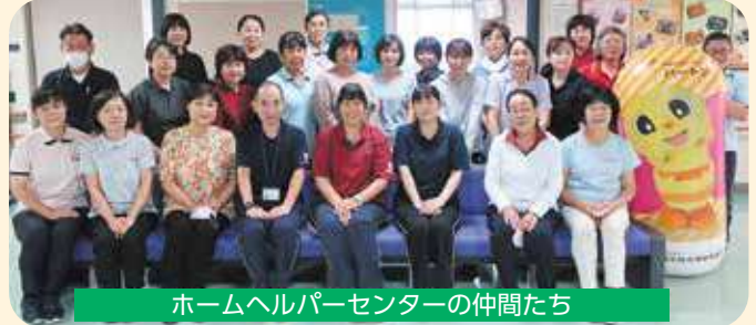
ホームヘルパーセンターの仲間たち