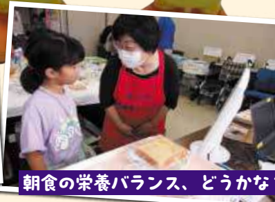
朝食の栄養バランス、どうかな?