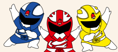
環境戦隊サルビアン