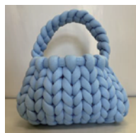
「マンドウバック」を手作りしましょう