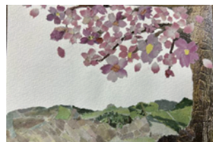
はじめての新聞ちぎり絵

日 12/8(金) 10:00~12:00 対 18歳以上 定 15名 参 無料