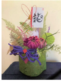
冬を彩るアーティフィシャルフラワー

日 1/13(土) 9:30~12:00 対 中学生以上 定 12名 参 一般 1,200円 中学生 1,100円