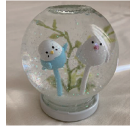
キラキラ☆スノードームをつくろう

日 12/7(木) 10:00~11:30 対 令和5年1月~9月 生まれの子と保護者 定 8組 参 100円