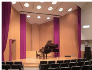
ホールピアノ体験