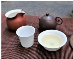
台湾茶・中国茶の魅力

日 12/6、20、1/10、31(水) 10:00~11:15 対 18歳以上 定 10名 参 800円