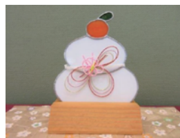
スタンドグラスの鏡もち