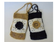
かぎ針でお花モチーフのスマホホルダー

日 12/26(火) 13:30~15:30 対 小学3~6年生 定 10名 参 100円