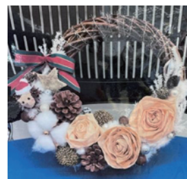
ウッドアートでリース作り