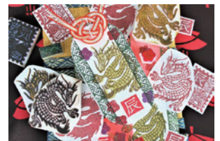
消しゴムはんこの世界

日 12/23(土) 10:00~12:00 対 小学4年生以上 定 16名 参 一般 500円 小中学生 400円