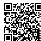
児童クラブ 一覧表

※申請書等は10月2日(月)から市HPで配布。10月10日(火)からは、あんぱ〜く・各児童クラブで配布。