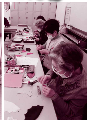
▲小物づくり講座(北部)

市内の各福祉センターでは、60歳以上の高齢者や障がいのある人を対象に生きがいづくりや介護予防、仲間づくりを目的とした講座を開催しています。陶芸や料理、体操など様々な講座を開催していますので、あなたに合う講座が見つかるかもしれません。次のページでは、「和裁講座」と「はじめてのズンバゴールド講座」に参加されている人へのインタビューや、各福祉センターの講座をご紹介します。