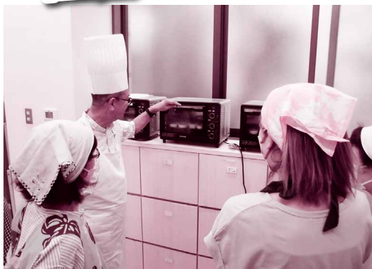
▲パティシエ講座(作野)