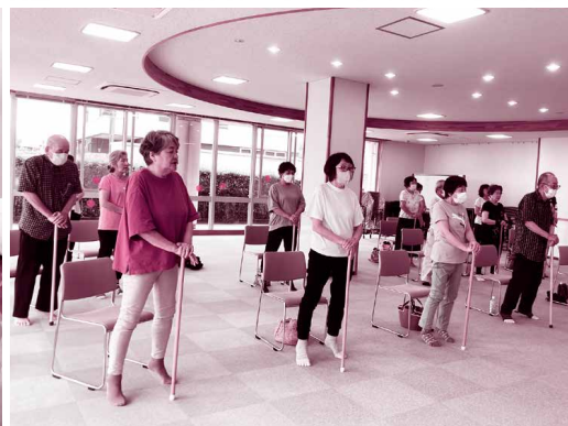
▲シニアのためのフィットネス講座(中部)