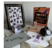
季節のグリーティングカード作り