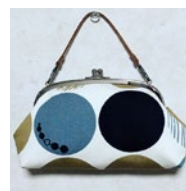
手縫いでがまぐちポーチ