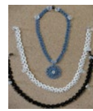
身近に楽しむタティングレース