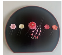
つまみ細工(初心者向け)