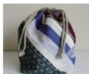
着物リメイク~巾着バッグ作り~