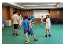
お菓子作り&レクゲーム