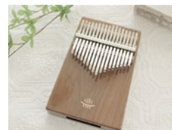
癒しの楽器♪カリンバ講座