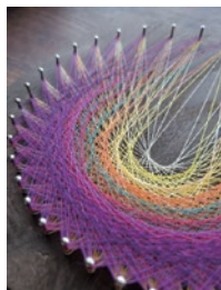
糸かけアート体験