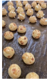
シュー生地を極めよう!