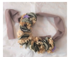
ユーカリリーフのハーブリース