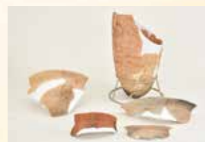
▲出土した土師器の甕