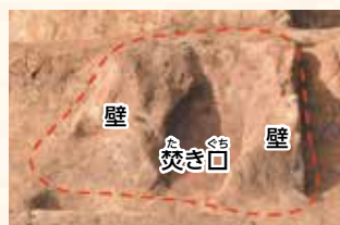
▲奈良時代のカマド跡