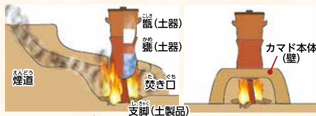
▲カマドイメージ図

今回の調査で確認したカマド跡は、本体の壁がしっかり残っており、構造がよくわかります。カマド跡やその周辺からは、調理に使われた土師器の甕が出土しました。