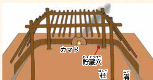
▲竪穴建物イメージ図