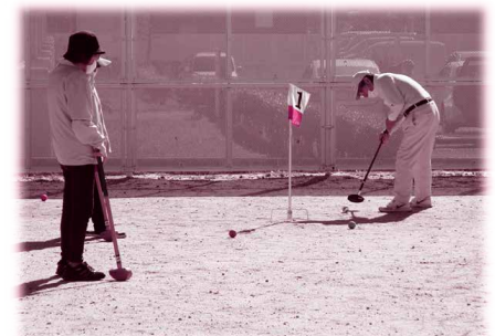
▲グラウンドゴルフの様子

虚弱の状態をいいます。健康な状態と要介護状態の間に位置し、適切な治療や予防を行うことで要介護状態に進まずにすむ可能性があります。