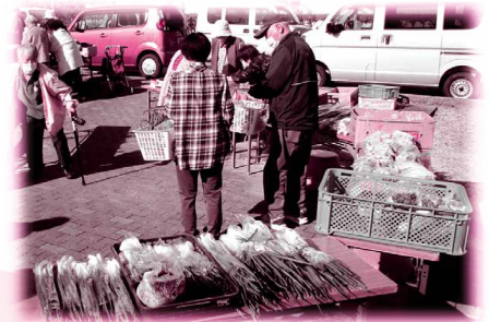
▲野菜市での安否確認

サロンでお会いしていた方は元気かな、フレイルになってしまわないだろうか心配になりました。また、活動者同士もお互いに顔を合わせることがなくなり、心配をしていました。そこで、町内に来る移動販売車や住宅で開催される野菜市で、見守りや安否確認を行うようにしました。