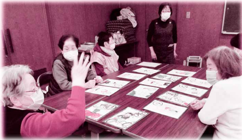
▲ふれあいサロンの様子

コロナ禍の影響でサロンが中止になったときは、人付き合いが減り、会話する機会がなくなってしまってとても寂しかったです。