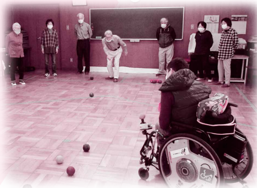
▲ポッチャサークルの様子