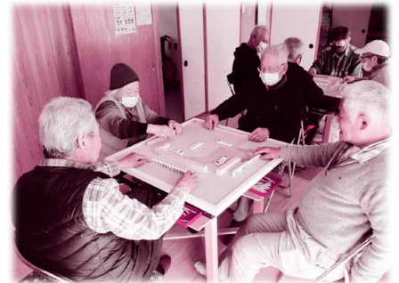
▲健康麻雀サロンの様子

ふれあいサロンやアンフレ（アンチフレイル※の略、体操サロン）、健康麻雀サロン、グラウンドゴルフ、カラオケサロン、ドリーム、ポッチャサークルを行っています。これらのサロンを合わせると、週に2日くらいの頻度でサロンを開催しています。ふれあいサロンでは、かるたやビンゴゲーム、ボランティアによるマジックの披露など、毎月違うイベントを行っています。