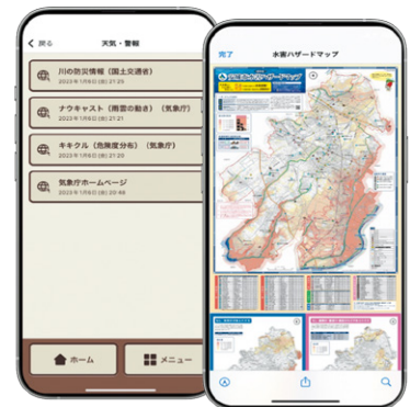
安城市防災・行政アプリ ▲