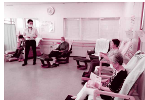
ふらっと健康講座