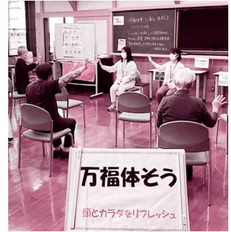
なつかし学級（万福体そう）