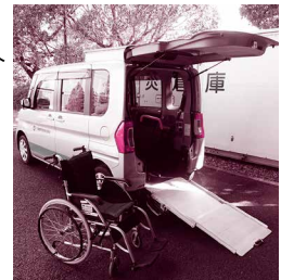
車いす、車いす移送車の貸出し