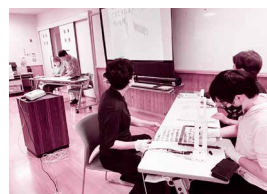
文字支援ボランティア講座