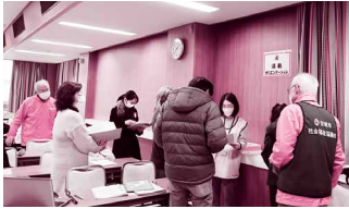
災害ボランティアセンター運営訓練