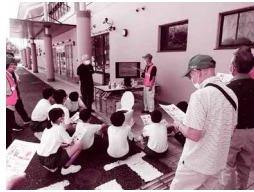
中学生防災隊防災教室