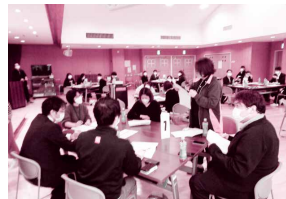
地域ケア地区会議