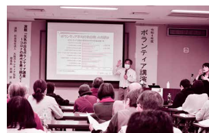
ボランティア講演会