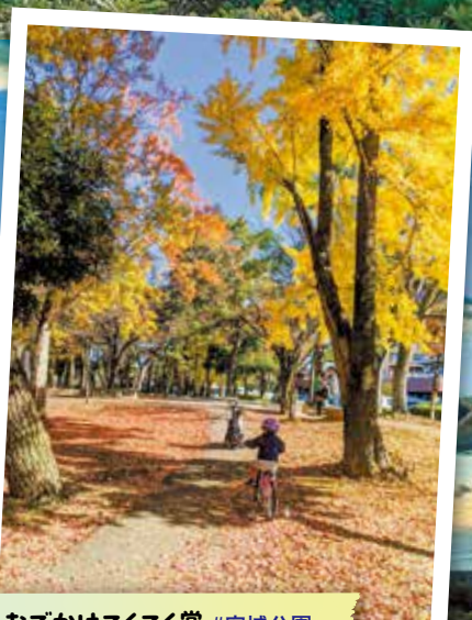
おでかけてくく賞 #安城公園