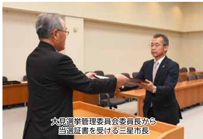
大見選挙管理委員会委員長から 当選証書を受ける三星市長