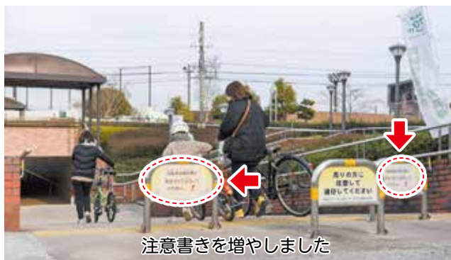
注意書きを増やしました

地下道を安全に通行できるよう「周りの方に注意して通行してください」という案内を掲示し、注意喚起をしていましたが、ご意見を受け、追加で注意書きを掲示する等の対策を実施しました。