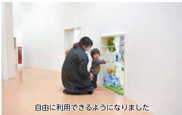
自由に利用できるようになりました

「でんでんむしのへや」については、日本図書館協会のガイドラインの更新に伴い、読み聞かせ会以外の時間でも利用できるよう、運用を変更しました。