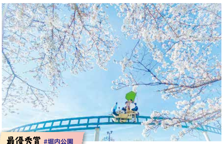
最優秀賞 #堀内公園