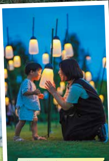
美味しい!楽しい! いいじゃん賞 #デンパーク