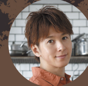
寺田真二郎 (料理研究家)