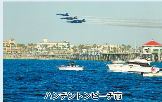
ハンチントンビーチ市