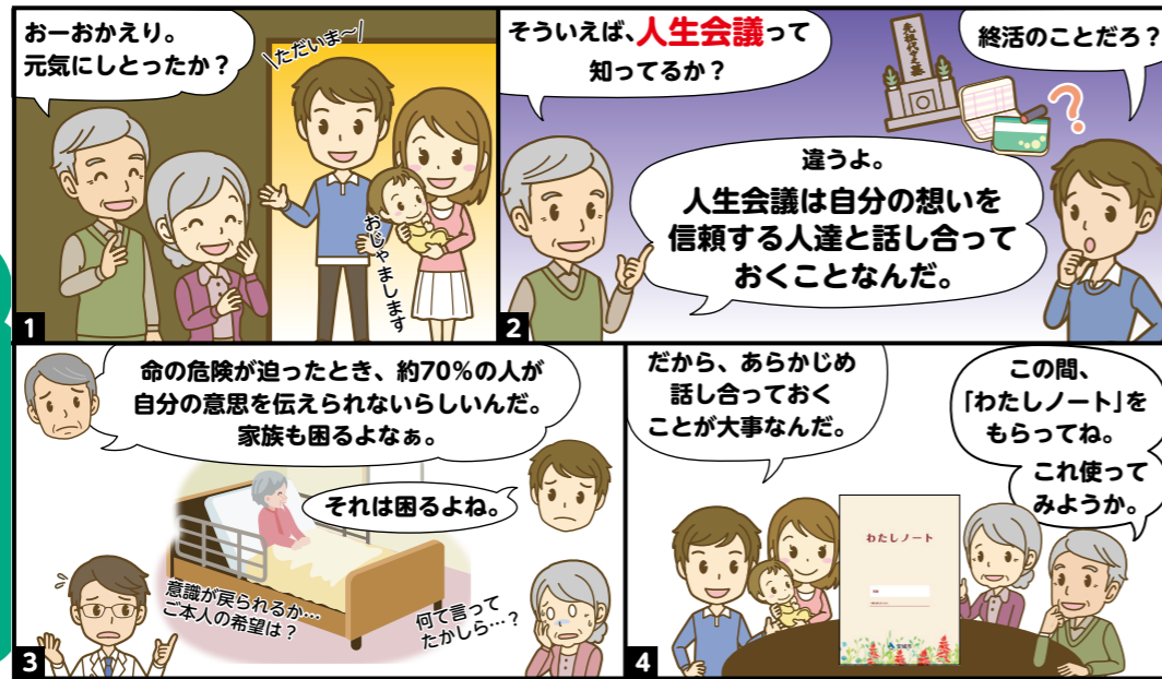
「わたしノート」は高齢福祉課、各福祉センター、各地域包括支援センター等で配布しています。