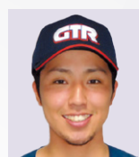
23 しん なか ふう き