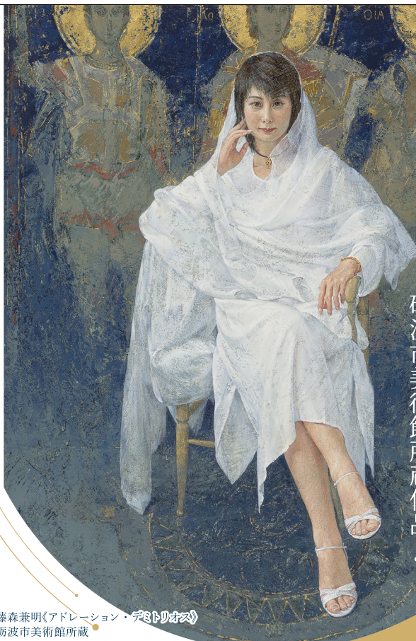
藤森兼明《アドレシオン・デストロイズ》 砺波市美術館所蔵