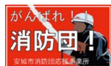
▲消防団応援事業所ステッカー

地域の安全・安心を守る活動を行っている消防団員を支援するため、市内各所に「消防団応援事業所」として登録していただいている店舗から、様々なサービスを受けることができます。(例えば購入金額から〇%割引等)