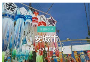
くらしの手続ガイド ライフイベントに合わせて必要な手続きをご案内します。